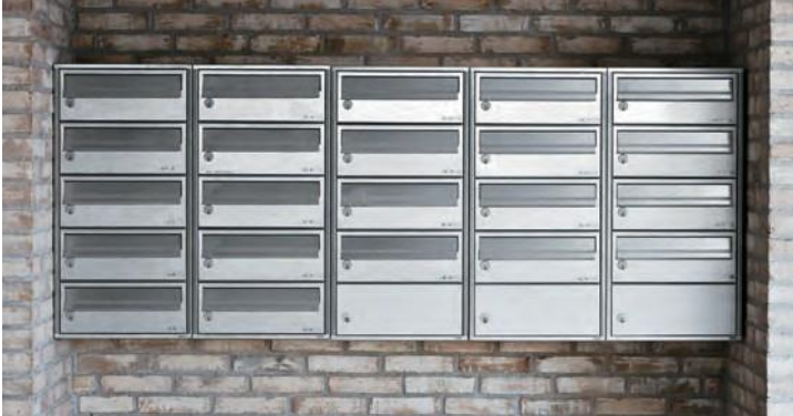
701 – ruostumattomasta teräksestä