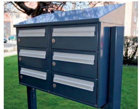
701 – asennus ulos katolla ja sivutulpilla (lisävarusteita)