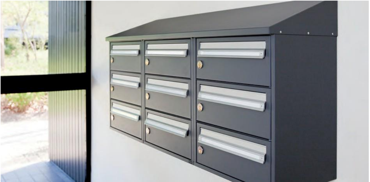
701 – asennus seinälle katolla (lisävaruste)